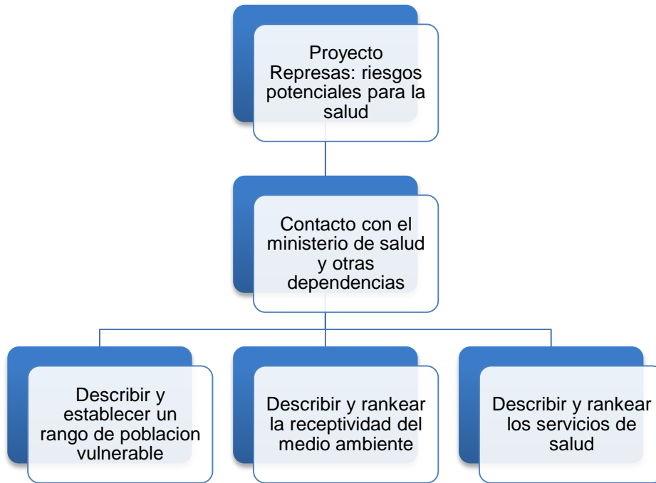
Figura 3-2. Procedimientos para definir salvaguardas y medidas de mitigación.

Para esto se debe entrevistar a especialistas en el campo de diferentes sectores y representantes de las comunidades afectadas.